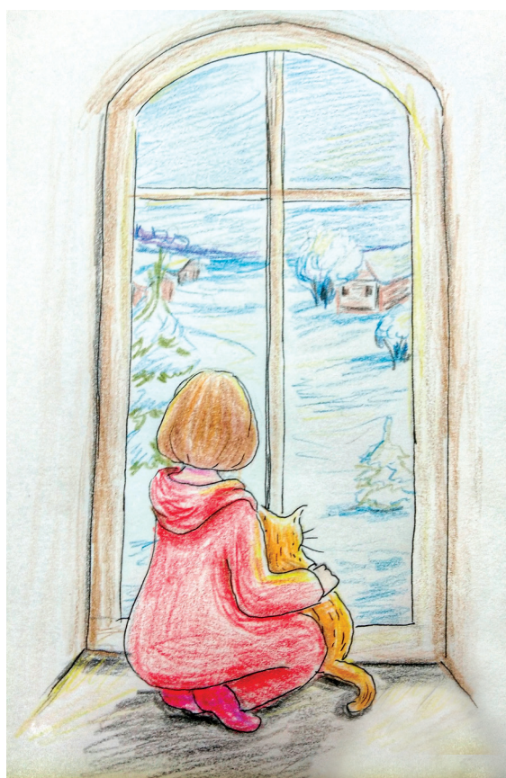
Рисунок Ольги Шмелевой

Покормите птиц зимой. Пусть со всех концов К вам слетятся, как домой, Стайки на крыльцо.