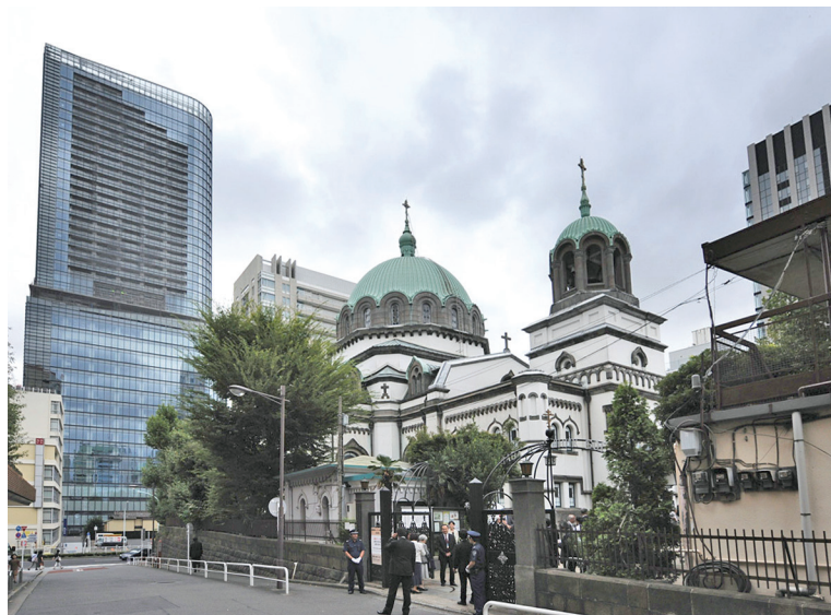
Собор Воскресения Христова в Токио