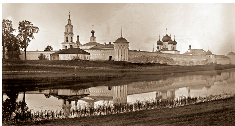
Калязинский Троицкий монастырь

Нетленные останки преподобного вернули на Калязинскую землю в 2012 году. Святые мощи Макария «пришли» домой по водам великой русской реки с большим волжским крестным ходом. Это событие совпало с 465-летием прославления преподобного Макария Калязинского на Московском Соборе. Рака с мощами была перенесена в Вознесенскую