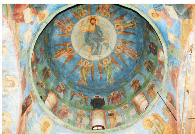
Начало 1140-х годов. Спасо-Преображенский собор Мирожского монастыря, Псков

” В КАЖДОМ СЛОВЕ, ЗВУКЕ ГРУСТИ НЕТ, ЛИШЬ СВЕТАЯ РАДОСТЬ, ОБРАЩЕНИЕ УМА И СЕРДЦА К ВОЗНОСЯЩЕМУ ХРИСТУ.