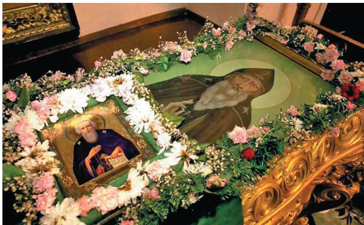
Мощи преподобного Паисия Галичского