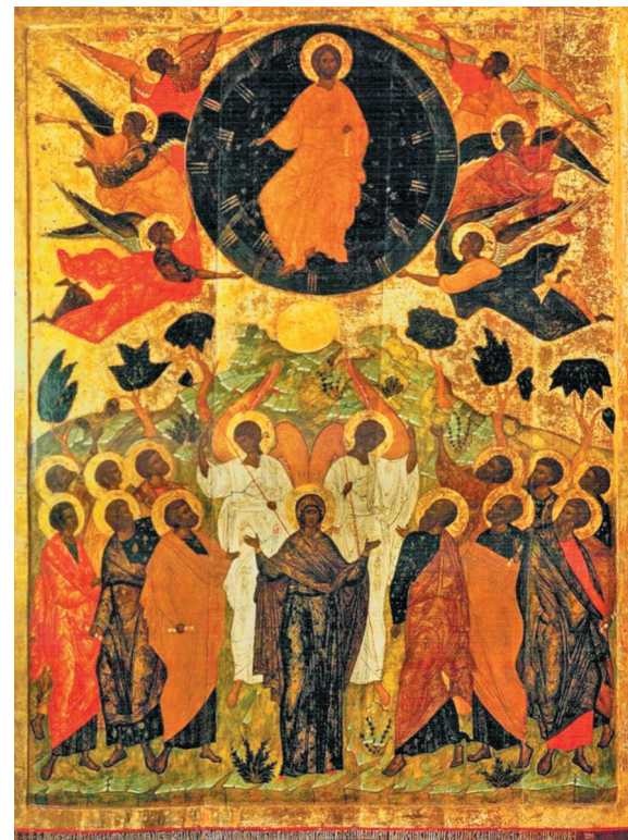
1542 год. Из Ново-Вознесенской церкви во Пскове. Новгородский государственный музей-заповедник