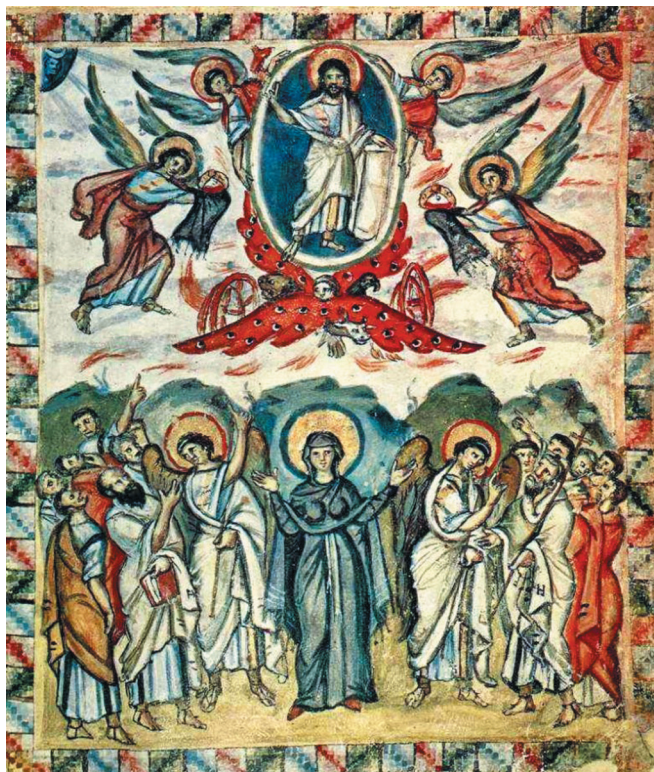
Миниатюра Евангелия Равулы. 586 год. Библиотека Лауренциана, Флоренция

” В КАЖДОМ СЛОВЕ, ЗВУКЕ ГРУСТИ НЕТ, ЛИШЬ СВЕТАЯ РАДОСТЬ, ОБРАЩЕНИЕ УМА И СЕРДЦА К ВОЗНОСЯЩЕМУ ХРИСТУ.