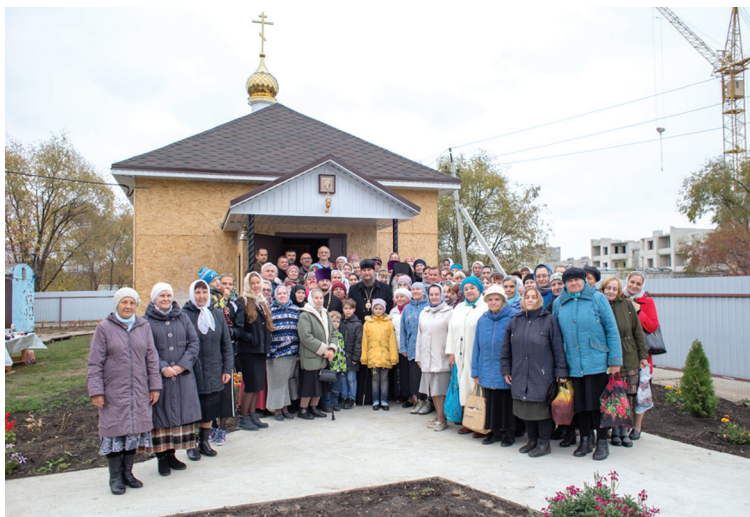
Храм в честь Благовещения Пресвятой Богородицы г. Балаково