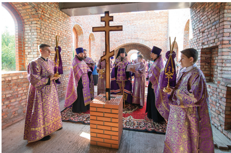
Чин основания храма во имя мученика Иоанна Воина в с. Лавровка

Пока же работы продолжают: одна бригада штукатурит внутри, вторая возводит колокольню. Недавно на строительной площадке вновь побывал владыка Пахомий. Параллельно закладывают фундамент под здание просторной воскресной школы. В ближайших планах — огородить и благоустроить территорию. «На все воля Божия, но стараемся успеть ко дню памяти мученика Иоанна Воина, к празднику 12 августа. Возможно, состоится Великое освящение храма», — надеется настоятель.