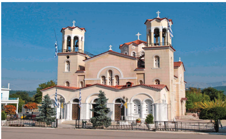
Храм во имя праведного Иоанна Русского на острове Эвбея

Удивительный случай произошел в России в 1998 году. В молодой московской семье обнаружили рак крови у полугодовалой девочки. Три года мать с ребенком провели в больницах, но девочка умирала. Тогда родителям посоветовали последнее средство — пересадку костного мозга. Начались поиски средств, но за год удалось собрать лишь двадцатую часть нужной суммы.