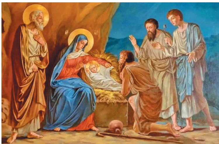
Рождество Христово. Роспись в Храме Христа Спасителя