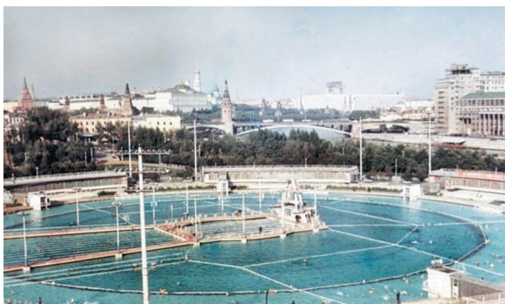
Бассейн на месте храма