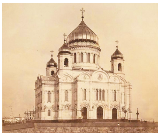
Храм Христа Спасителя в начале XX века