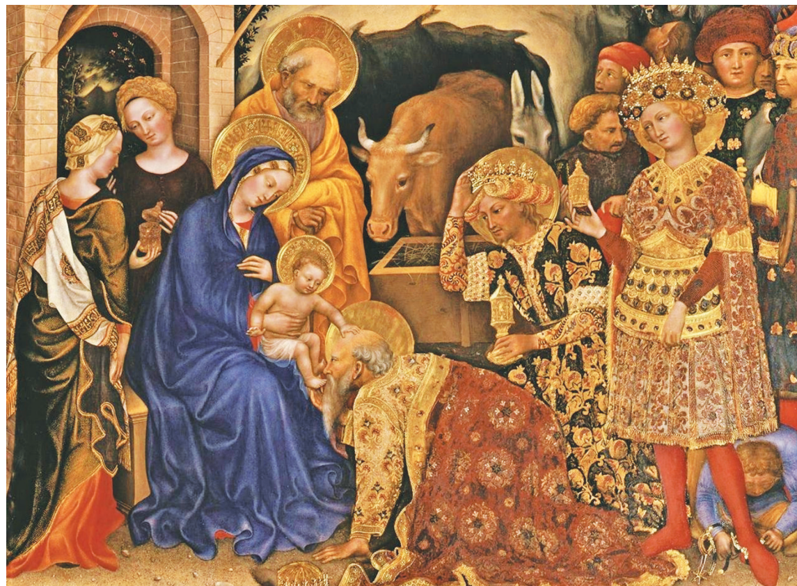
Джентиле да Фабриано. Поклонение волхвов

” ВОЛХВЫ ПРОДЕЛЫВАЮТ ОГРОМНЫЙ ПУТЬ, ЧТОБЫ ПОКЛОНИТЬСЯ БОГОМЛАДЕНЦУ И ПРИНЕСТИ СВОИ ДАРЫ — ЗОЛОТО, ЛАДАН И СМИРНУ.