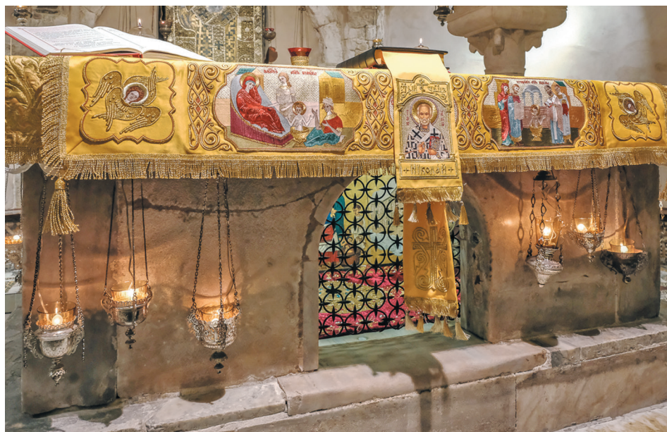
Мощи святителя Николая в Бари (Basilica di San Nicola)